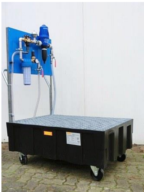
Mobilní vozík s dávkovacím zařízením a odkapávací vanou pro přípravu řezných kapalin