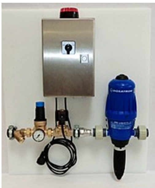
Zařízení pro bezpečné dávkování chloru v plaveckém bazénu

Let's look at chlorine dosing for cleaning swimming pools. Often the concentrated chlorine is poured onto the edge of a swimming pool, rinsed with water and then this mixture is manually distributed on the surface of the water and finally discharged via the overflow gutter. As a result, either too much or too little chlorine is used which can lead to significant environmental and health risks. By using an LDT proportional metering pump the right amount of calcium hypochlorite is added to chlorinate water. The hydro-powered volumetric pumps from LDT provides high accuracy dosing and works with a volumetric hydraulic motor which enables continuous injection of liquid or soluble concentrate. The result is controlled hygiene and increased environmental protection through safe management of dangerous fluids.